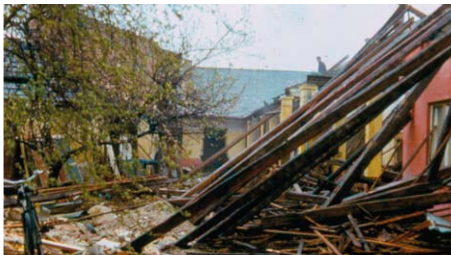
Az újpesti Deák Ferenc utcai üzem szanálása

Apám 1965-ben elnyerte „Az Ipar Kiváló Mestere” címet, 1960-ban a „Kiváló ipari tanuló nevelésért” is elismerő oklevelet kapott. 1967-ben a „Jó minőségért” jelvényt nyerte el. Tagja volt a KIOSZ (Kisiparosok Országos Szervezete) újpesti vezetőségének és a budapesti Mestervizsga Bizottságnak. 1980-ban az újpesti nagyrekonstrukció