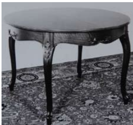
Exportra készített bútorok

felszerelések egyre nehezítették a lassan modernizálódó bútorgazdaságban a naprakész lépéstartást.