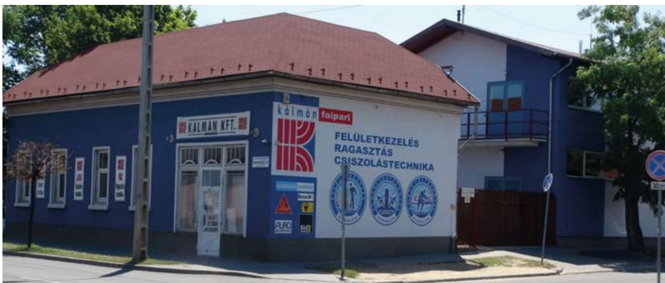
Rákospalota Szentmihályi út az átépítés után

A cég forgalma, üzletköre és tevékenysége az évek alatt folyamatosan bővült és növekedett. A fejlődés töretlen volt és jelenleg is több elképzelés van a még hatékonyabb működés elérésére.