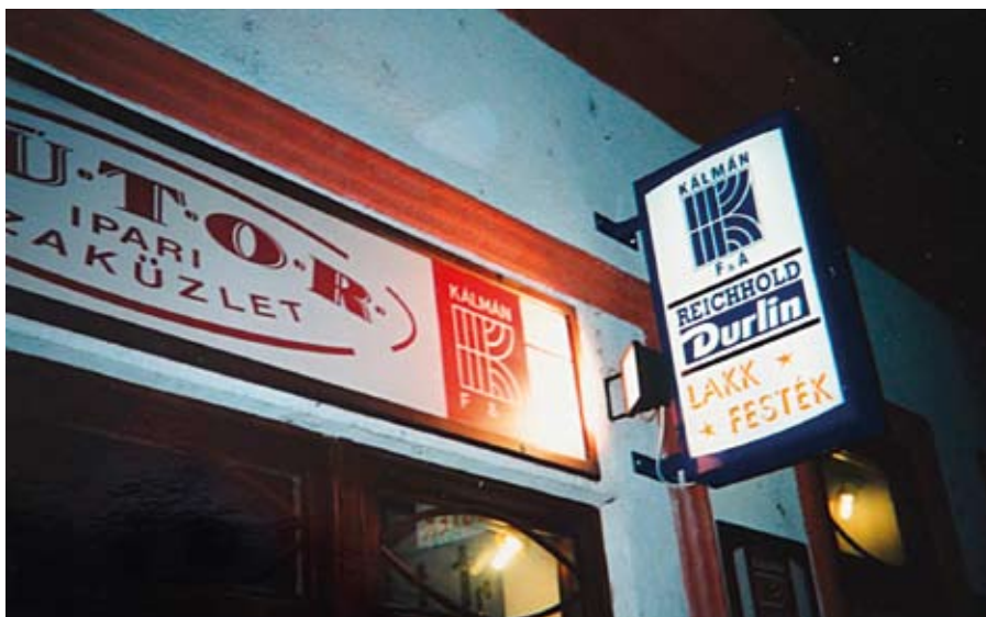
Bútoripari szaküzlet Újpesten a Nádor utcában

1989-90-ben a váltás idején viszont már tisztán látszott, hogy sem a relatíve kis műhely, sem a korszerűnek nem mondható technológia rövidesen nem teszi versenyképpé a céget a gomba módra szaporodó modernebb vállalkozásokkal szemben. A Deák utcai üzem tovább építésére nem volt lehetőség, egy új üzem létrehozására nem volt elég tőke -