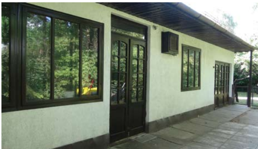
Újra műhely az újpesti Deák utcában